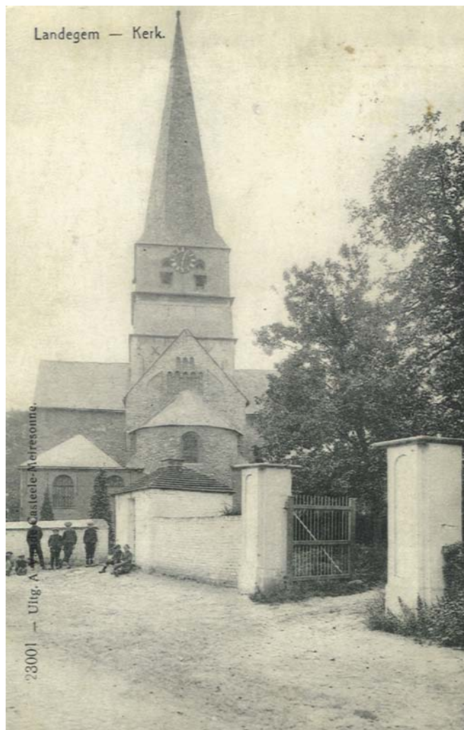
De kerk van Landegem op een Feldpostkarte uit 1916.