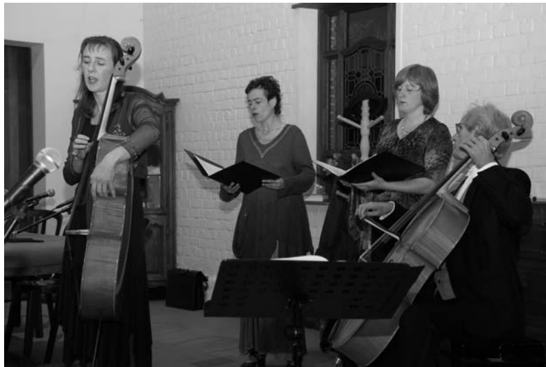
Het Aquarius Ensemble.

Tussendoor genieten we samen van het optreden van het Aquarius Ensemble dat ons o.a. meevoert op een muzikale rondreis door Frankrijk, Rusland en Vlaanderen.